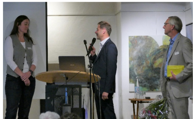
WDR Fernsehaufnahme am 16. April 2019 in Venlo