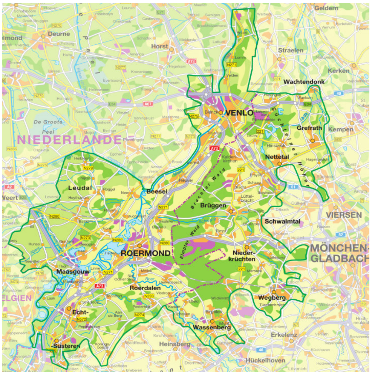
Verbandsgebiet Naturpark MSN

Zum Zweckverband Naturpark MSN gehörten 2019 die niederländischen Gemeinden Beesel, Echt-Susteren, Leudal, Maasgouw, Roerdalen, Roermond und Venlo sowie der Zweckverband Naturpark Schwalm-Nette. Das Verbandsgebiet umfasst das Verbandsgebiet des Zweckverbands Naturpark Schwalm-Nette und die Gemeindeflächen der niederländischen Verbandsmitglieder. Der grenzüberschreitende Naturpark hat eine Größe von rund 1.080 km 2 . Folgende Abbildung zeigt die Lage des Verbandsgebiets.