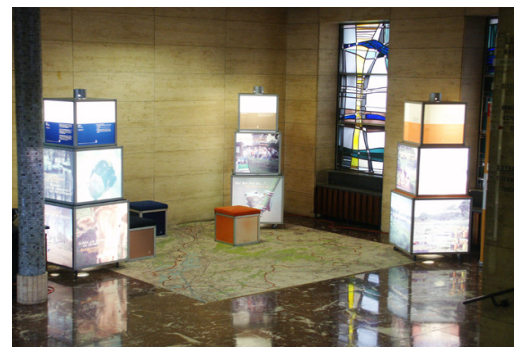
Ausstellung im Rathaus MG-Rheydt

In 2008 wurde die Ausstellung insgesamt 11 mal in der Region präsentiert. Tabelle 4 gibt eine Übersicht der Ausstellungsorte.