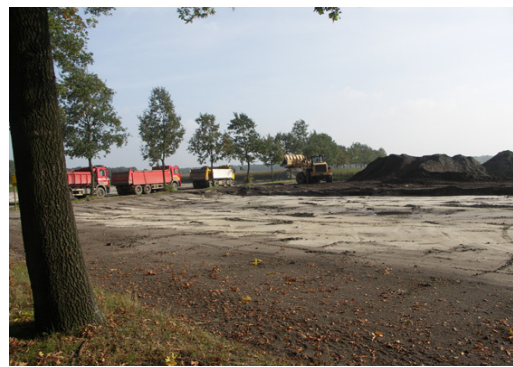
Umwandlung landwirtschaftlicher Flächen

Ferner führte die Stichting het Limburgs Landschap eine Machbarkeitsstudie zur Wiederherstellung der Schlossgräben von Kasteel Montfort aus.