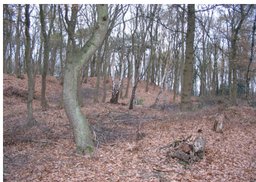
Schanze bei Beesel

Die benachbarten Grenzgemeinden Beesel und Brüggen verfügen beide über eine sehr interessante Kulturgeschichte, wobei viele Zeugen der Vergangenheit noch heute in der Kulturlandschaft zu erkennen sind. Die beiden Gemeinden haben nun die Initiative ergriffen, ihr kulturelles Erbe gemeinsam grenzüberschreitend in einer archäologisch-kulturhistorischen Route zu präsentieren.