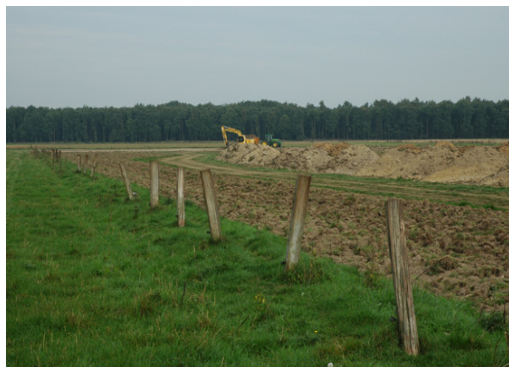
Bodenlagerstätte am Wolfsplateau

Nach erfolgreichen Renaturierungsmaßnahmen in den Naturschutzgebieten Blankwater und Herkenboscher Venn wurden 2008 noch der Abtransport des Bodens und der Abbau der Lagerstätten von Staatsbosbeheer umgesetzt.