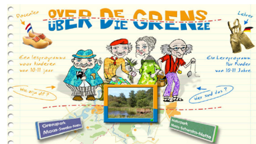
Unterrichtsprogramm „Über die Grenze“

Das Unterrichtsprogramm „Über die Grenze“ für deutsche und niederländische Grundschulen, bei dem es um die Natur, Landschaft und Kulturgeschichte des Naturparks Maas-Schwalm-Nette geht, konnte 2008 inhaltlich abgeschlossen werden. Die Unterrichtsmappen werden derzeit fertig gestellt, um damit in den kommenden Monaten bei den Schulen für das Programm zu werben. Anhand des Unterrichtsprogramms sollen sich Schülerinnen und Schüler allmählich in die Entstehungsgeschichte dieser Region einarbeiten. Dabei finden die Schulfächer Geschichte, Geografie und Biologie besondere Berücksichtigung.