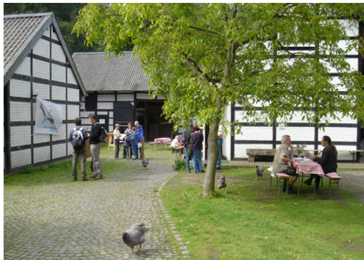
NABU Naturschutzstation Wildenrath

Auch das Netzwerk der 21 Besucherzentren wurde nach dem Projektende fortgeführt. 2008 wurden in enger Zusammenarbeit mit dem Naturpark Schwalm-Nette zwei Treffen des Netzwerkes organisiert. Im Mai fand ein Treffen in der NABU Naturschutzstation Wildenrath statt, bei dem ferner das kurz zuvor eröffnete Naturerlebnisgelände besichtigt wurde. Im September traf sich das Netzwerk im Roerstreekmuseum in St. Odiliënberg. Auch hier gab es eine Führung durch die Ausstellung deren Schwerpunkte in der Geologie und Archäologie der Region liegen.