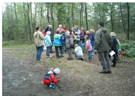
Geführte Wanderung im Naturpark

Im Dezember 2008 wurde der Veranstaltungskalender für den Zeitraum Januar bis April 2009 mit 186 Veranstaltungen veröffentlicht. Der Veranstaltungskalender steht ferner immer aktuell auf der Internetseite des Naturparks www.naturpark-msn.de . Der